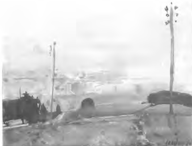
Rudolf Zender, Paris/Oberwil

Vom 2. November 2019 bis zum 7. Februar 2020 ist die Bilderschau jeweils am Donnerstag von 14.00 Uhr bis 18.00 Uhr zu besichtigen. Die Werke stehen zum Verkauf. Betreut wird die Ausstellung von Willy W. Furrer, Schulhausstrasse 6, «Im Baumgarten», Bachenbülach, Telefon 044 860 47 10. Auch Christine Züllig, die im WohnenPlus in der Berglistrasse 22, Bülach, wohnt (Telefon 044 860 10 62), wird gerne Auskunft erteilen.