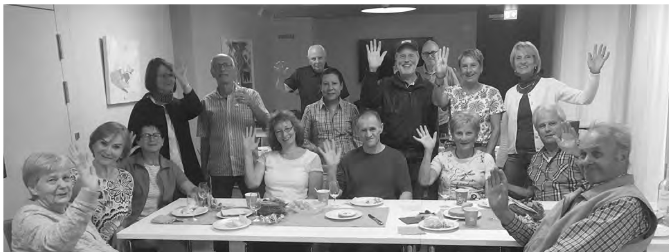
Ein Teil der Teilnehmenden am diesjährigen Treffen «kleiner Umtrunk – grosser Dank»