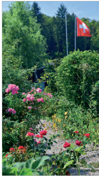
AZB CH-8180 Bülach