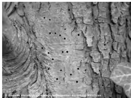
Hier war ein Borkenkäfer am Werk.

Die Larve höhlt die Triebe aus und zerstört so die Bahnen für den Wasser- und Nährstofftransport. Sind die Zweige innen hohl, so war die Miniermotte am Werk.