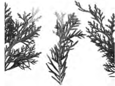
Frass-Bild einer Miniermotte

Wer bereits eine Thujahecke hat, sollte um gute Wachstumsbedingungen bemüht sein. Genügend Nährstoffe und Bodenfeuchtigkeit sind zwingend für einen guten Erfolg. Will jemand trotz der Probleme eine Thujahecke anpflanzen, so ist eine vorgängige Abklärung betreffend des Standortes und der Ansprüche der Pflanzen nötig.