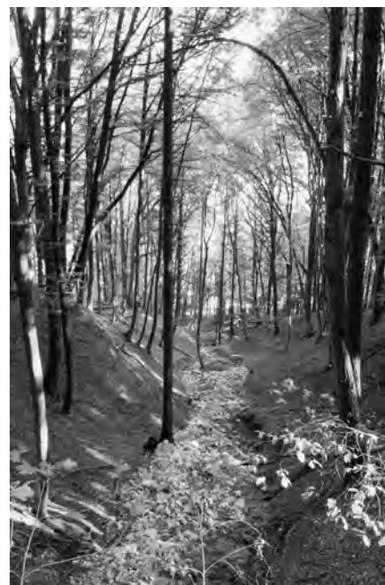
Bild: Der Blick folgt dem Bachlauf hinunter ins Wehntal. Im trockenen Spätsommer ist das vom Unwetter im Mai mitgetragene Geschiebe gut sichtbar.