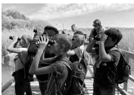
Klasse 3a beim Beobachten der Vögel im Neeracherried