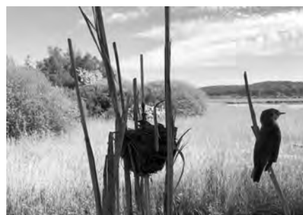
Präparat eines Teichrohrsängers und sein Nest im Schilf im Neeracherried.