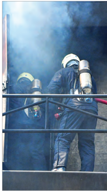
AZB CH-8180 Bülach