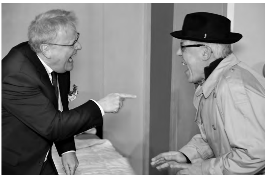
«Ist es lustig? Wir finden: Ja!»