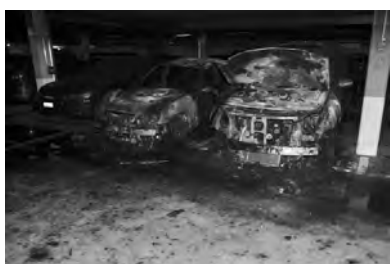
Autobrand in einer Tiefgarage in Opfikon.

Autos enthalten grosse Mengen an brennbaren Stoffen wie z.B. Kunststoffe, Gummi, Treibstoff, entzündbare/schmelzende Metalle usw. Nebst der extrem grossen Hitze, die