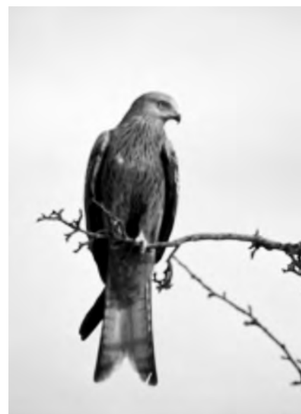
Im Winter halten sich im Unterland grössere Gruppen von Rotmilanen auf.