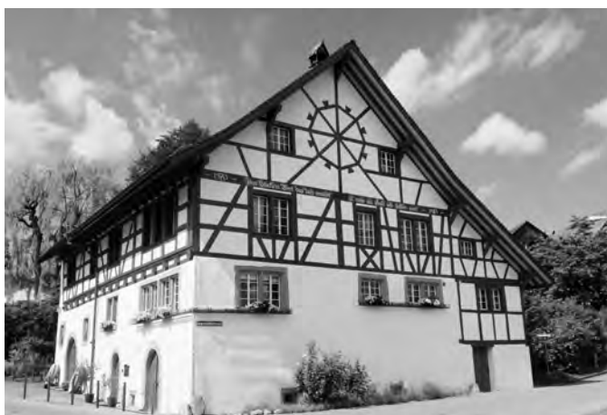
Am Mühletag hat die schicke Geigenmühle und das Mühlencafé von 10.00 bis 17.00 Uhr geöffnet.