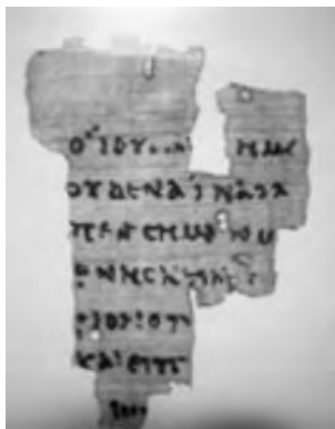
Fragment ca. 100 – 125 n. Chr.