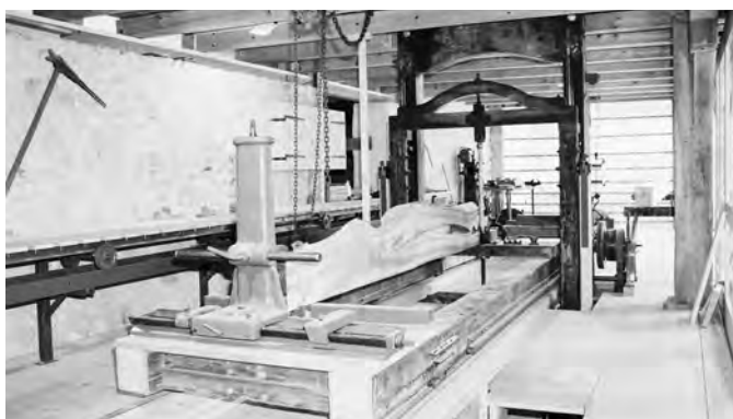
In der Häumüli Embrach wird neben der Mühle auch die Gattersäge mit Wasser angetrieben.

Gattersagi Buchberg: info@gattersagi.ch , Telefon 044 867 30 21 Geigenmühle Neerach: geigenmuehl@hotmail.com , Telefon 044 858 01 10 Häumüli Embrach: kari.iten@bluewin.ch , Telefon 044 865 51 67