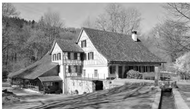
Mitten im Grünen liegt die Häumüli Embrach. Sie hat am Mühletag von 10.00 bis 17.00 Uhr geöffnet.