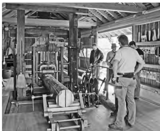
Blick in die Gattersagi Buchberg. Der Motor wurde Anfang des 20. Jahrhunderts von der Firma Landert in Bülach produziert.