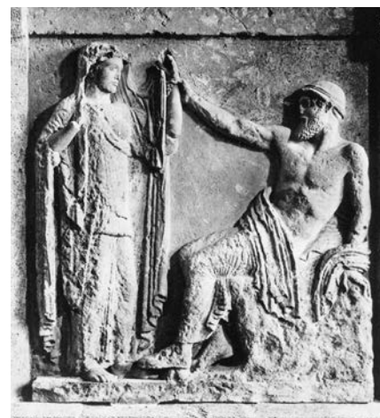
Legende: Heirat von Zeus und Hera, Tempel von Selinus, 6. Jh.v.Chr.