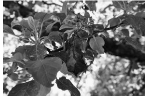
typische Feuerbrandsymptome an Apfel

Feuerbrand ist eine bakterielle Pflanzenkrankheit, die in Kernobstanlagen, Hochstammobstgärten und Baumschulen (Apfel, Birne, Quitte) grossen Schaden anrichten kann. Zu den Wirtspflanzen gehören auch Cotoneaster, Scheinquitte, Feuertorn, Vogelbeere und Weissdorn. Eine vollständige Wirtspflanzenliste und viele weitere Informationen zu Feuerbrand sind auf der Internetseite www.feuerbrand-zh.ch zu finden. Sie können bei der Gemeindeverwaltung das Merkblatt «Feuerbrand im Hausgarten» gratis beziehen.