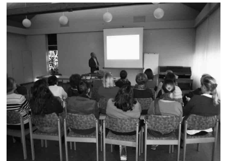
Informationstreffen der freiwilligen Cafeteria- und Fitnessraumbetreuer «Im Baumgarten» am 07. Dezember 2015 im Pavillon.

Für die Alterskommission Bachenbülach Th. Biber