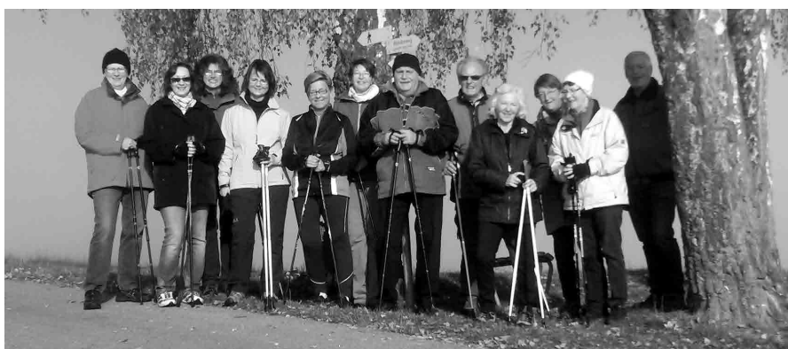
Die Nordic Walking Gruppe unterwegs am 04. November 2015 über den Brueder.

Für die Alterskommission Bachenbülach: Th. Biber