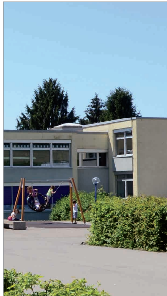
AZB CH-8180 Bülach