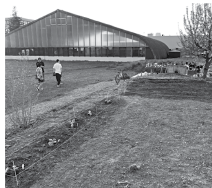
Ein schöner Tag neigt sich dem Ende zu.

Wir sind sehr gespannt darauf, wie unsere Pflanzen in Zukunft wachsen. Das heisst für uns: Weiterhin Unkraut jäten und viel bewässern, damit der Ajuga-Garten wächst und gedeiht.