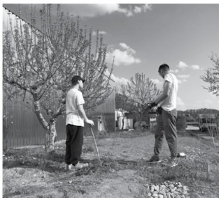
Spatenstich für den Ajuga-Garten.

Ein besonderes Highlight in diesen Wochen war der Gartentag am Jugendraum Bachen-