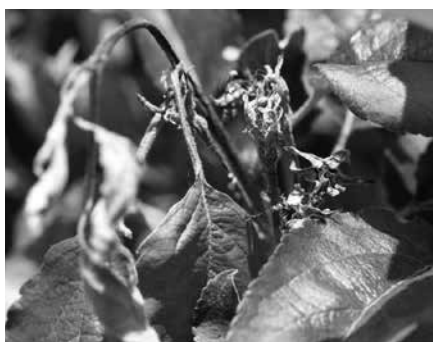
Typische Feuerbrandsymptome an Apfel mit Blüten und Triebbefall.

Hauptsächlich über die Blüte dringen die Feuerbrandbakterien in die Wirtspflanzen ein. Vom Stielgrund her verfärben sich Blüten und Blätter braun bis schwarz. Oft krümmt sich die Spitze befallener Äste hakenförmig. Äste bis hin zur ganzen Pflanze sterben ab. Erste Symptome sind wenige Wochen nach der Blüte, meist ab Anfang Juni, sichtbar.