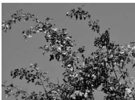
Stark befallener Weissdorn.