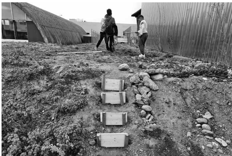
Die Kids sind im Garten aktiv!

Euer Spielwiesen-Team, Dieter und Lorena