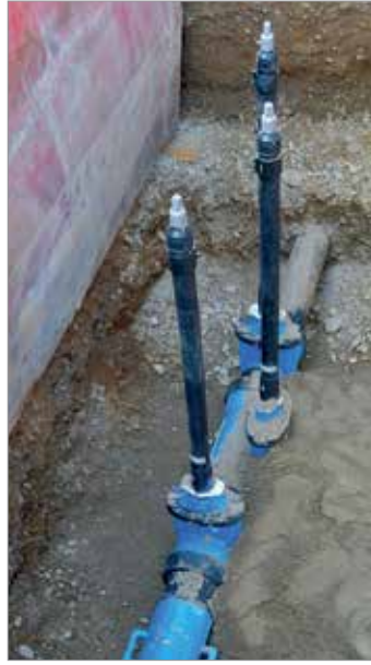
AZB CH-8180 Bülach