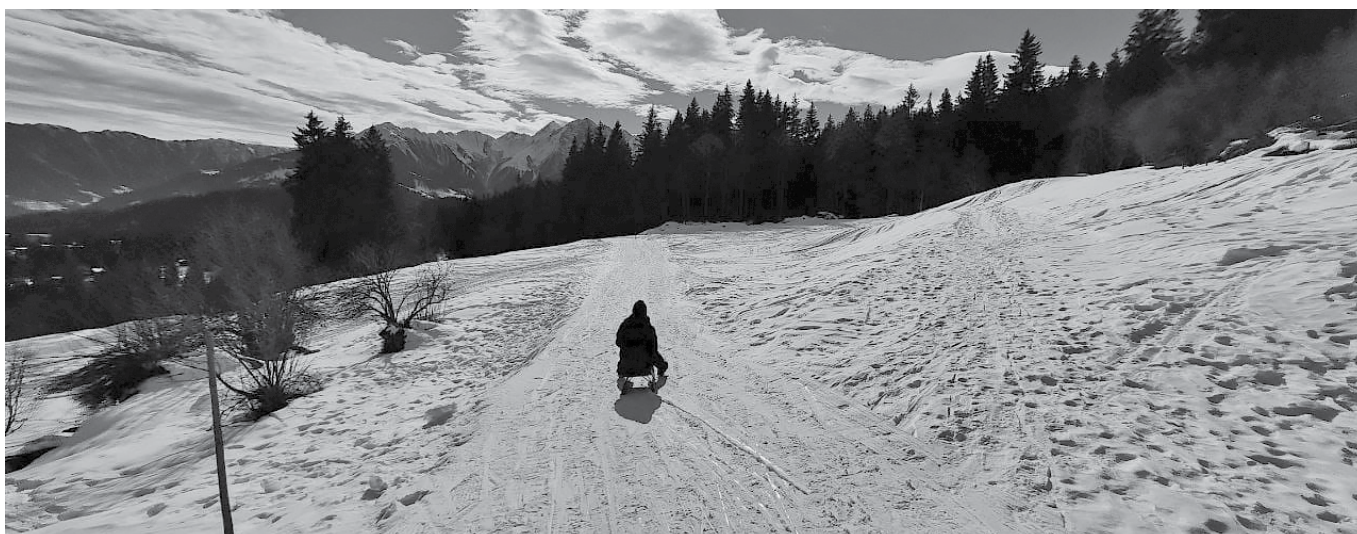
Schlittelausflug in den Sportferien.

In den Sportferien ging es zum Schlitteln in die Glarner Bergenwelt. Gemeinsam mit den Kids machten wir uns auf die Reise nach Elm, um dort die kilometerlange Schlittenpiste runter zu rasen. Wir hatten perfektes Wetter, blauer Himmel und Sonnenschein und konnten die schöne Aussicht auf die Bergwelt geniessen. Die Kinder fuhren um die Wette und dem ein oder anderen Crash konnten wir nicht aus dem Weg fahren. Glücklicherweise ging es nach sechs Abfahrten zum Zug und nach Hause Richtung Bülach.