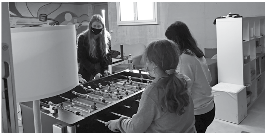
Der Töggelikasten ist beliebt bei den Kids.

Aber auch der Töggelikasten rumpelt munter. Und für Kinder, die es lieber ein bisschen ruhiger haben, gibt es Brettspiele, Heftli und Darts und natürlich auch unseren Basteltisch, wo man Malen, Basteln, Kleben und Ausprobieren kann.