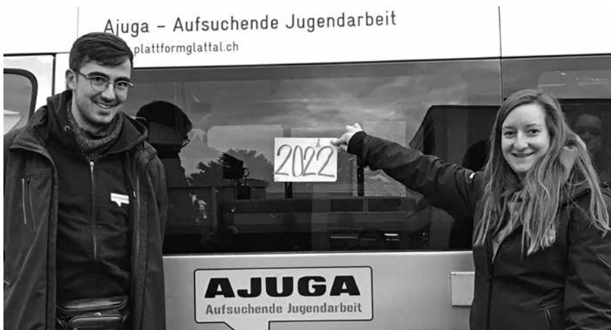
«Es Guets 2022» wünschen Stipe und Charlotte.

Eure Ajuga Bachenbülach Stipe & Charlotte