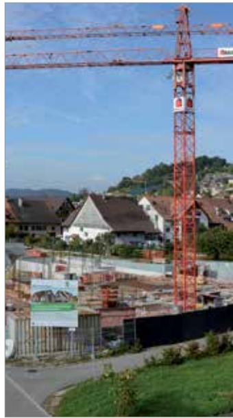
AZB CH-8180 Bülach