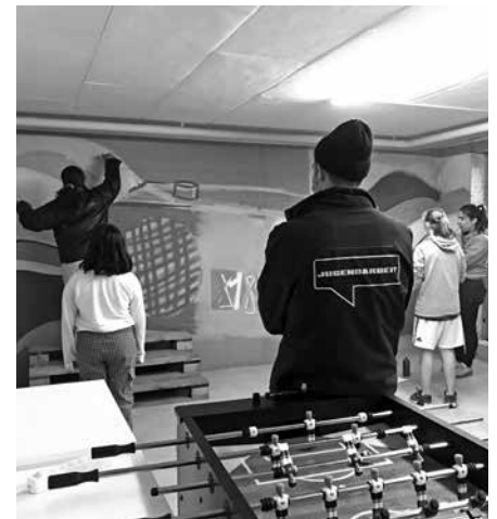
Eindrücke vom Graffiti-Workshop.