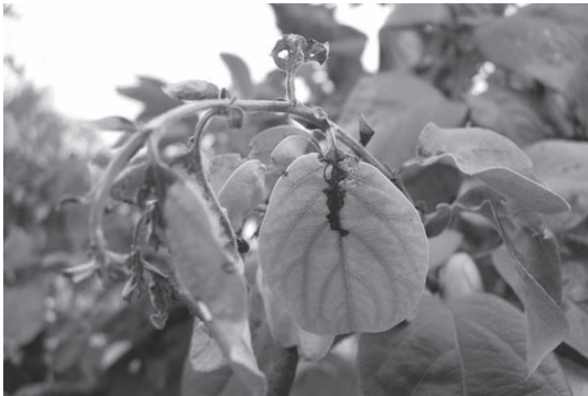
typische Feuerbrandsymptome an Quitte

Obstproduzenten Ihrer Gemeinde sind Ihnen dankbar, wenn Sie mithelfen, den Feuerbrand-Befallsdruck so niedrig wie möglich zu halten.