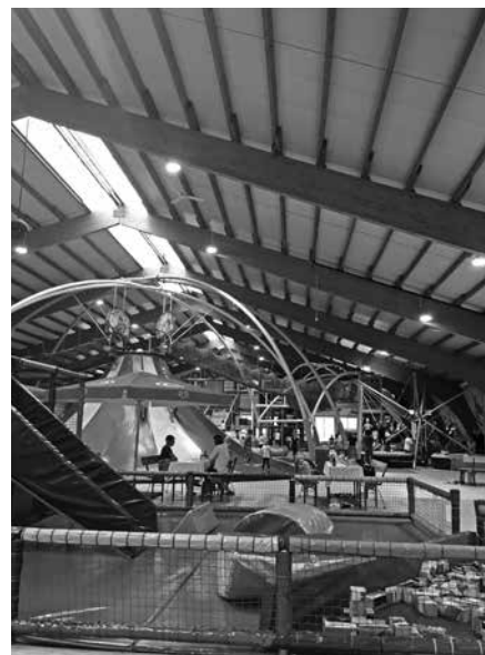
Trampolino-Ausflug in den Sommerferien.