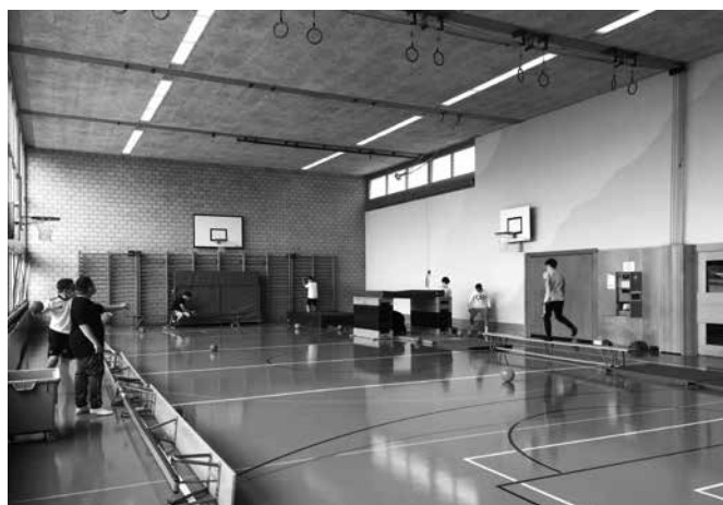
Das Turnhallen-Angebot findet mittwochs von 15-17 Uhr am Schulhaus Halden statt.