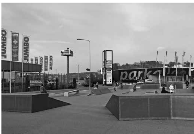
Ab sofort sind wir Donnerstag und Freitag zwischen 18 und 20 Uhr am Jugendplatz.