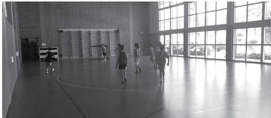
Die Kids lieben Fussball.

Wir wünschen allen Kindern tolle Sommerferien und freuen uns auf ein Wiedersehen nach den Ferien.