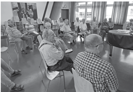
... viel Platz von Sänger zu Sänger.