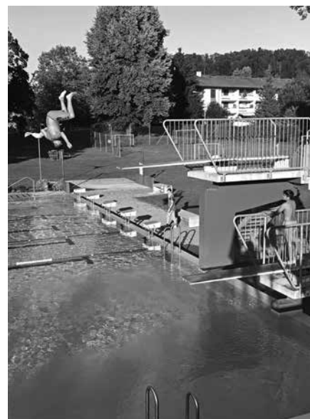
Die Jugendlichen zeigen ihre besten Sprünge.