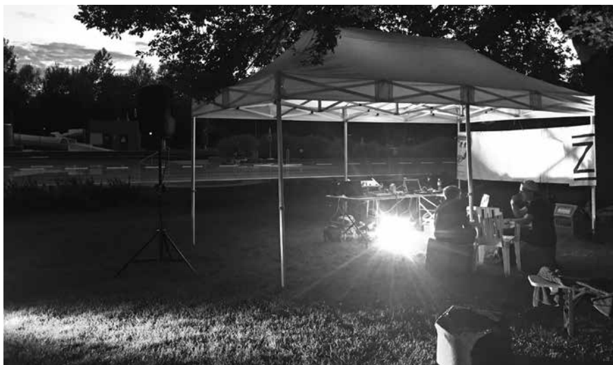
Die Out-of-School Lounge lädt zum Chillen ein.

Nach dem Jump-Contest ging es mit der Out-of-School Lounge weiter. Die Jugendlichen fanden einen Platz zum chillen, quatschen oder zum Fussball und Frisbee spielen und liessen so einen abwechslungsreichen Abend ausklingen. Die beiden Events haben uns sehr viel Spass gemacht. Besonders toll war es, dass die Badi am Abend ganz für die