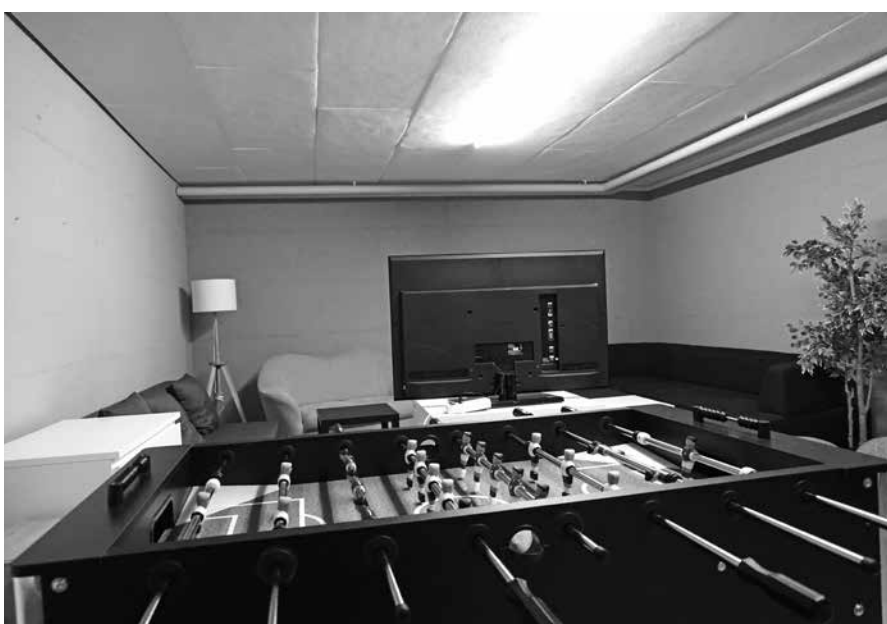
Der neue Jugendraum in der Zivilschutzanlage.

mehr als solche gebraucht wird. Der Raum wird in diesen Tagen auch mit einer Treppe erschlossen, die zur Wiese und einem Sitzplatz führt und zusätzlich mit einem Fenster Tageslicht in den Untergrund bringt.