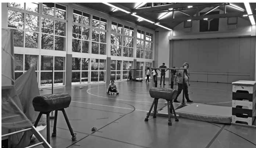
Die Kids haben Spass in der Mehrzweckhalle.

Was wir genau vorhaben, ist momentan noch in Vorbereitung und deshalb streng geheim. Wir verraten an dieser Stelle nur, dass es eine grössere Bastelarbeit werden