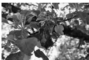
typische Feuerbrandsymptome an Apfel

Feuerbrand ist eine bakterielle Pflanzenkrankheit, die in Kernobstanlagen, Hochstammobstgärten und Baumschulen (Apfel, Birne, Quitte) grossen Schaden anrichten kann. Zu den Wirtspflanzen gehören auch Cotoneaster, Scheinquitte, Feurdorn, Vogelbeere und Weissdorn. Eine vollständige Wirtspflanzenliste und viele weitere Informationen zu Feuerbrand sind auf der Internetseite www.feuerbrand-zh.ch zu finden. Sie können bei der Gemeindeverwaltung das Merkblatt «Feuerbrand im Hausgarten» gratis beziehen.