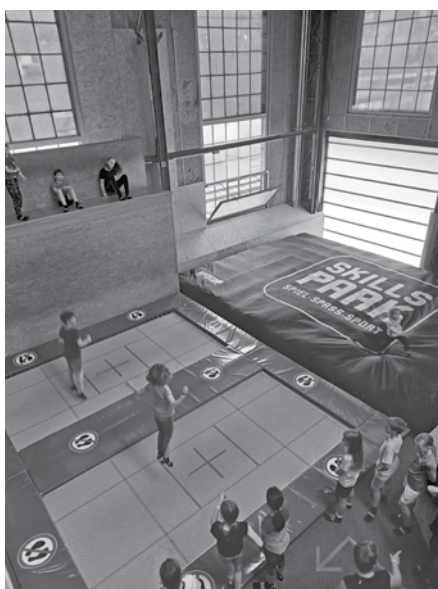
Spass im Skills Park.

Eure Ajuga Bachenbülach Stipe & Charlotte