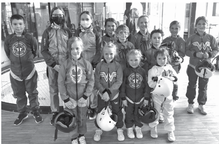
Glückliche Kids nach dem Fliegen.