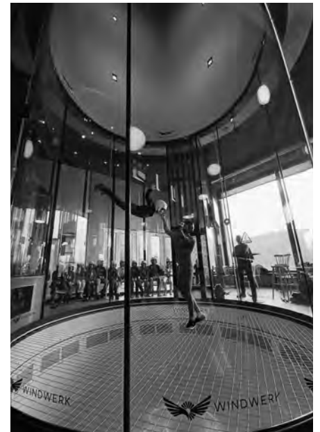
Sky Diving in Winterthur