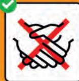
Hände schütteln vermeiden.