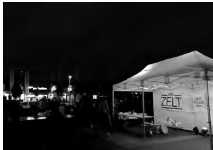
«Das Zelt» auf dem Jugendplatz

Eure Ajuga Bachenbülach, Charlotte & Stipe