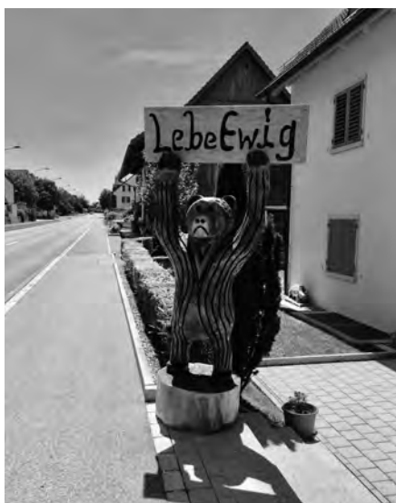
Bär mit Schild an der Zürichstrasse

Können wir wissen, dass wir ewig bei Gott leben werden? Und warum können Christen wissen, dass sie in den Himmel kommen? Die einfache Antwort ist: weil Gott sie liebt, weil Jesus Christus die Strafe für die Schuld am Kreuz schon bezahlt hat. Er selbst ist der