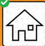
Bei positivem Test: Isolation. Bei Kontakt mit positiv getesteter Person: Quarantäne.