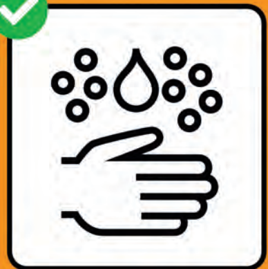
Gründlich Hände waschen.