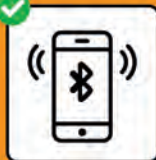
Um Infektionsketten zu stoppen: SwissCovid App downloaden und aktivieren.