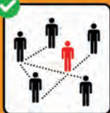
Zur Rückverfolgung immer vollständige Kontaktdaten angeben.