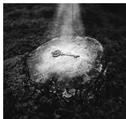
Der Schlüssel für die Himmelstüre