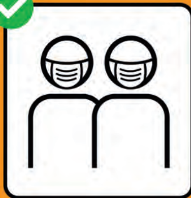
Maske tragen, wenn Abstandhalten nicht möglich ist.