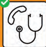
Nur nach telefonischer Anmeldung in Arztpraxis oder Notfallstation.