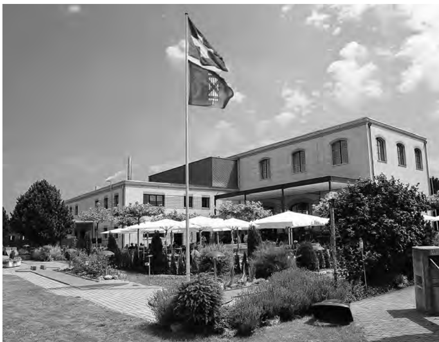
Freihof Brauerei & Hofstube, Flawilerstrasse 46, 9200 Gossau SG