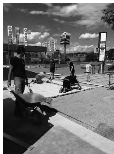
Bodenarbeiten auf dem Jugend- und Begegnungsplatz