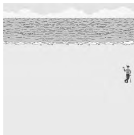
Wo ist Walter?