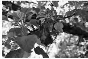
typische Feuerbrandsymptome an Apfel

Feuerbrand ist eine bakterielle Pflanzenkrankheit, die in Kernobstanlagen, Hochstammobstgärten und Baumschulen (Apfel, Birne, Quitte) grossen Schaden anrichten kann. Zu den Wirtspflanzen gehören auch Cotoneaster, Scheinquitte, Feuersdorn, Vogelbeere und Weissdorn. Eine vollständige Wirtspflanzenliste und viele weitere Informationen zu Feuerbrand sind auf der Internetseite www.feuerbrand-zh.ch zu finden. Sie können bei der Gemeindeverwaltung das Merkblatt «Feuerbrand im Hausgarten» gratis beziehen.