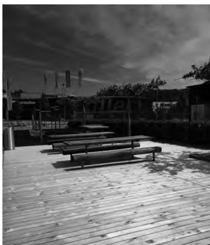
Neuer Boden auf dem Jugend- und Begegnungsplatz

Liebe Grüsse, Stipe und Charlotte Plattform Glattal